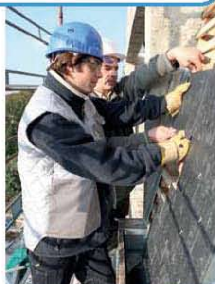
Mit dem Projekt men@work haben Betriebe jetzt die Chance, die Gesundheit ihrer vornehmlich männlichen Belegschaft zu unterstützen und mit Hilfe gezielter Maßnahmen zu verbessern.

Männer kommen in ihrer Freizeit und auch im Beruf vermehrt mit gesundheitlichen Risiken in Berüh-